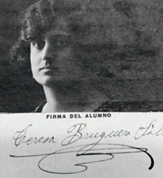
>> Foto i signatura de l'època estudiantil.